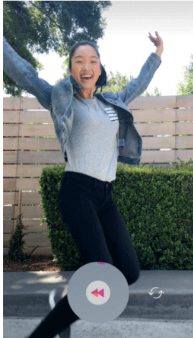
Instagram Funktion Rewind