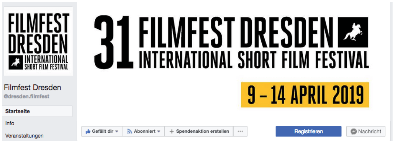
Abb. 2: Auf dem Computer sieht das Titelbild noch gut aus